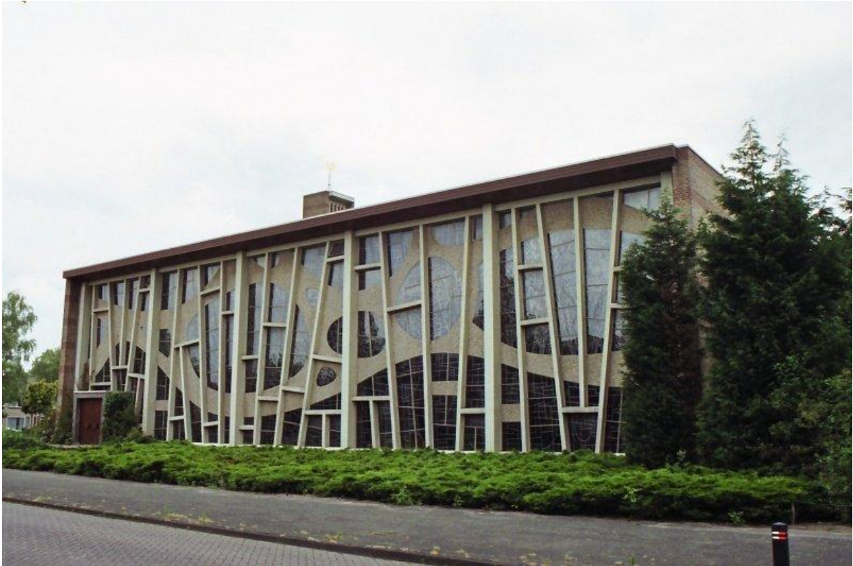
De buitenzijde van de Antonius van Paduakerk in Waalwijk met de glas-in-betongevel van Egbert Dekkers uit 1962.